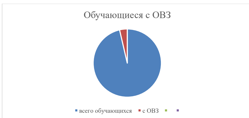
Число воспитанников с ОВЗ

С 01.10.2023 педагоги Детского сада осваивают функционал «Сферум»